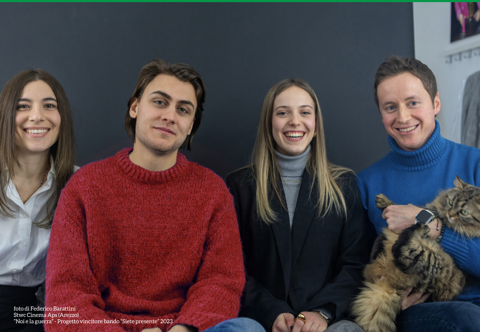
Stwc Cinema Aps (Arezzo) "Noi e la guerra" - Progetto vincitore bando "Siete presente" 2023